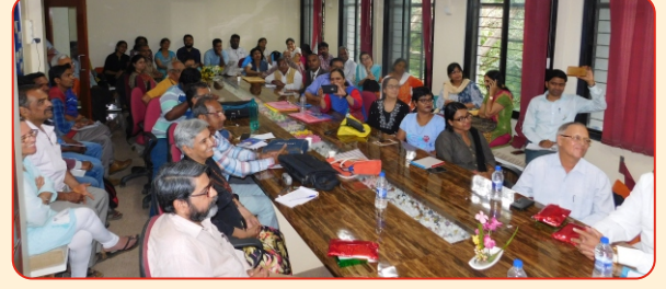
ब्राह्मी लिपि प्रशिक्षण कार्यशाला में उपस्थित प्रशिक्षणार्थी