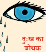
दुःख का बोधक