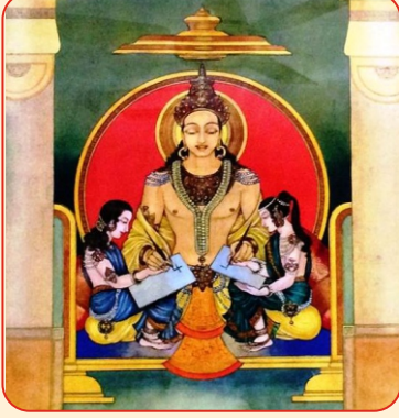
ब्राह्मी एवं सुंदरी को लिपि एवं अंकगणित सीखाते हुए भ. ऋषभदेव

प्राचीन भारतीय संस्कृति एवं इतिहास का अभ्यास लिपि एवं भाषा के ज्ञान से होता है। हमारी प्राचीन परंपरा में सुनकर याद रखा जाता था। उसे ही श्रुतपरंपरा