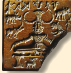
सिंधु घाटी सभ्यता में प्राप्त पशुपति का चित्र

२. भावलिपि - यह लिपि के विकास का दूसरा चरण है। चित्रलिपि में ही जब भाव अभिव्यक्त करने की प्रगति हुई तो वह भावलिपि के रूप में विकसित हुई। जैसे एक वृत्त (गोल) आकृति है उसका अर्थ सूर्य, ताप, प्रकाश, तारा आदि हो सकते हैं। दुःख के बोधक के रूप में आँख से गिरते आंसू के बूंद के प्रयोग भी हुए। इस भावमूलक लिपि के उदाहरण चीन, उत्तरी अमेरिका, पश्चिम आफ्रिका आदि देशों में प्रचुर मात्रा में