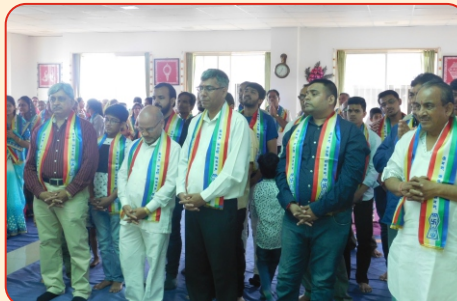
दि. १६-९-२०१८ श्री अंकलेश्वर श्वेतांबर मूर्तिपूजक जैन संघ, अंकलेश्वर